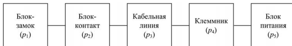
Рис. 2. Структурная схема надежности традиционной системы ОББ