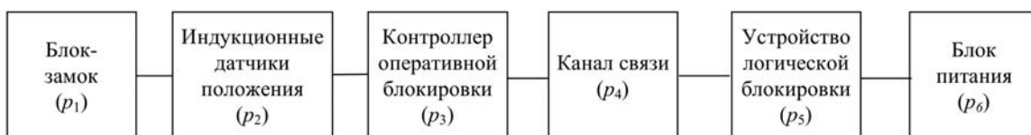
Рис. 3. Структурная схема надежности предлагаемой системы

1. Новая система, отличающаяся централизованным сбором и визуализацией данных о положении коммутационных аппаратов, позволяет выявить причину ошибочной блокировки за несколько минут. В то время как неисправный блок-кон-